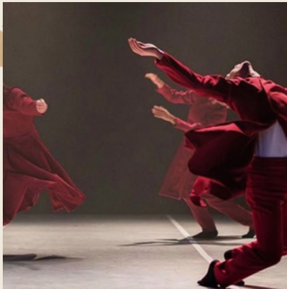
IN MORPHOSIS - CONTEMPORARY DANCE PROGRAM & CIE CORPS ITINERANTS