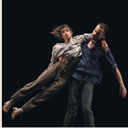
COMPAGNIE PAPER BRIDGE